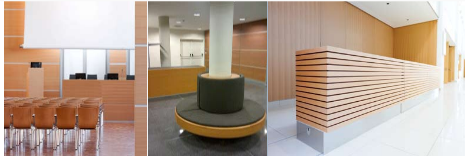
Sala conferenze Palacongressi di Rimini 2010