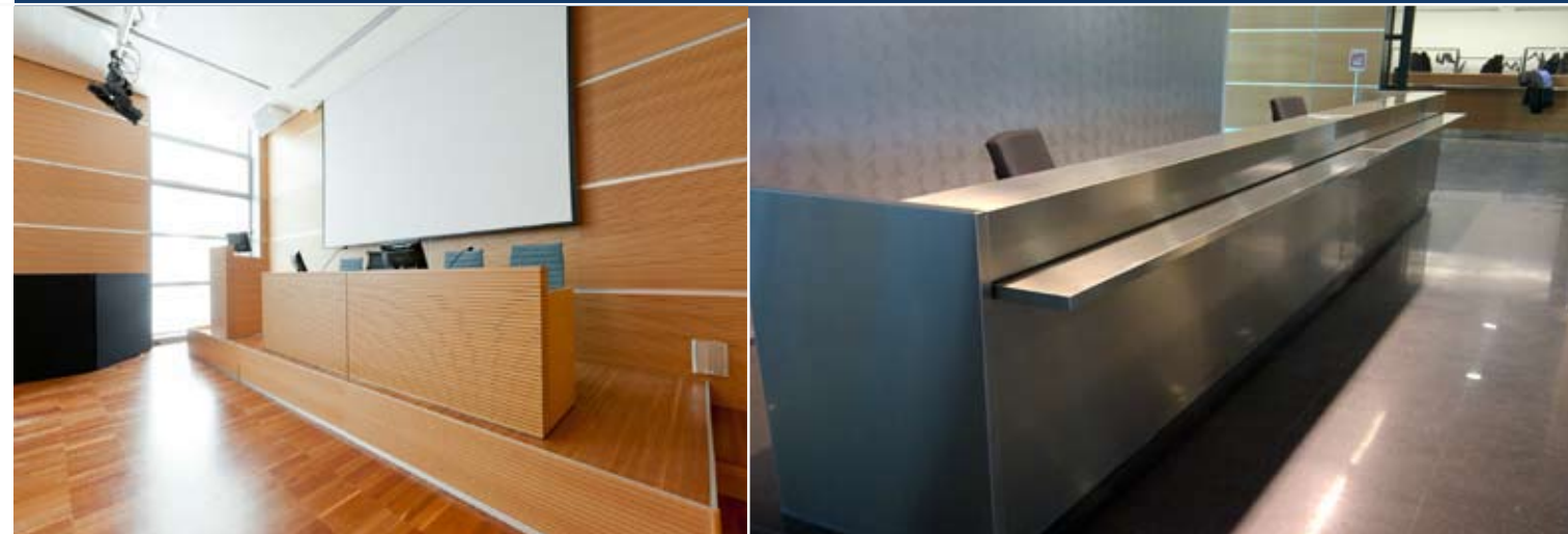
Sala conferenza Palacongressi di Rimini 2010