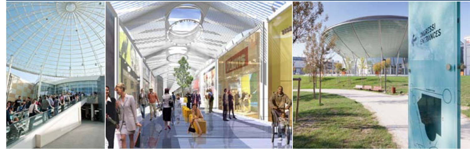
Centro Commerciale Punta di Ferro 2011