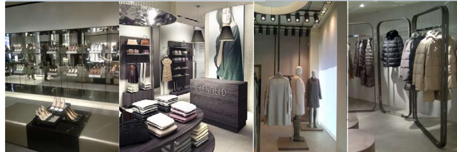
Casellario in vetro Emporio Armani Bologna 2012