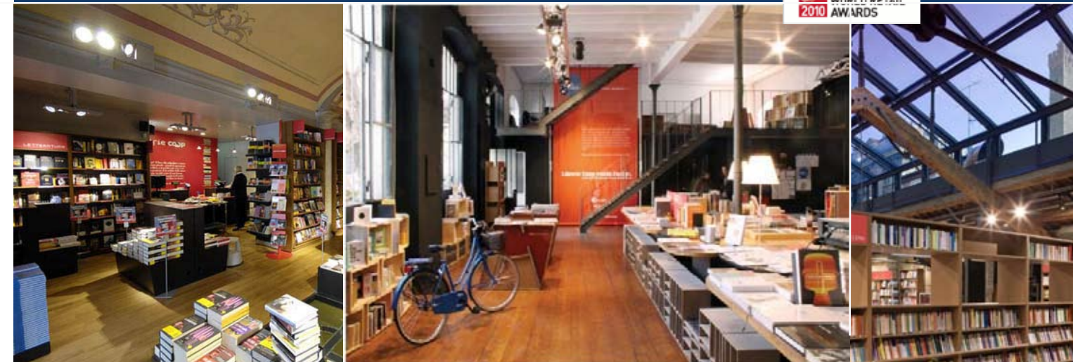
Interno Sestri Ponente Librerie Coop 2009